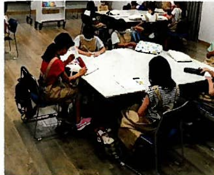
Bグループ 「チョコレート」