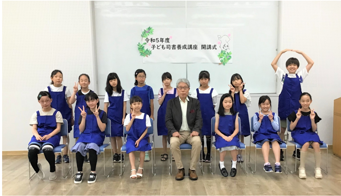
子ども司書2期生総勢14名と教育長(福岡憲助)との集合写真。=6月25日