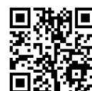
芦屋市電子図書館