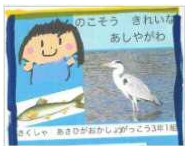
のこそうきれいなあしやがわ 朝日ヶ丘小学校 3年1組

知ってる？電子図書館では、市内の 小学生や幼稚園児のみんなが作った絵本や 紙芝居を見ることができるよ！ぜひ見てね！！