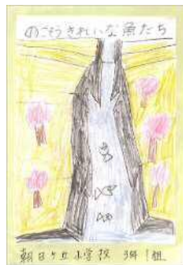
のこそうきれいな魚たち 朝日ヶ丘小学校 3年1組