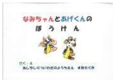
なみちゃんとあげくんのぼうけん 岩園幼稚園 すみれぐみ