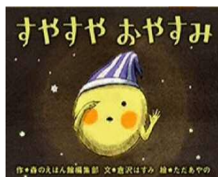
すやすやおやすみ