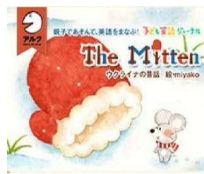
The Mitten-ウクライナの昔話