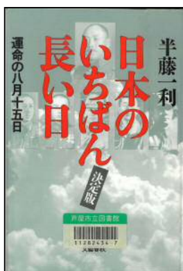
書名 : 日本のいちばん長い日 発行所 : 文藝春秋